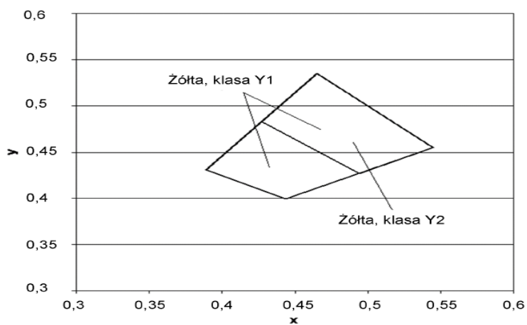
Rys.2. Współrzędne chromatyczności x, y dla barwy żółtej oznakowania